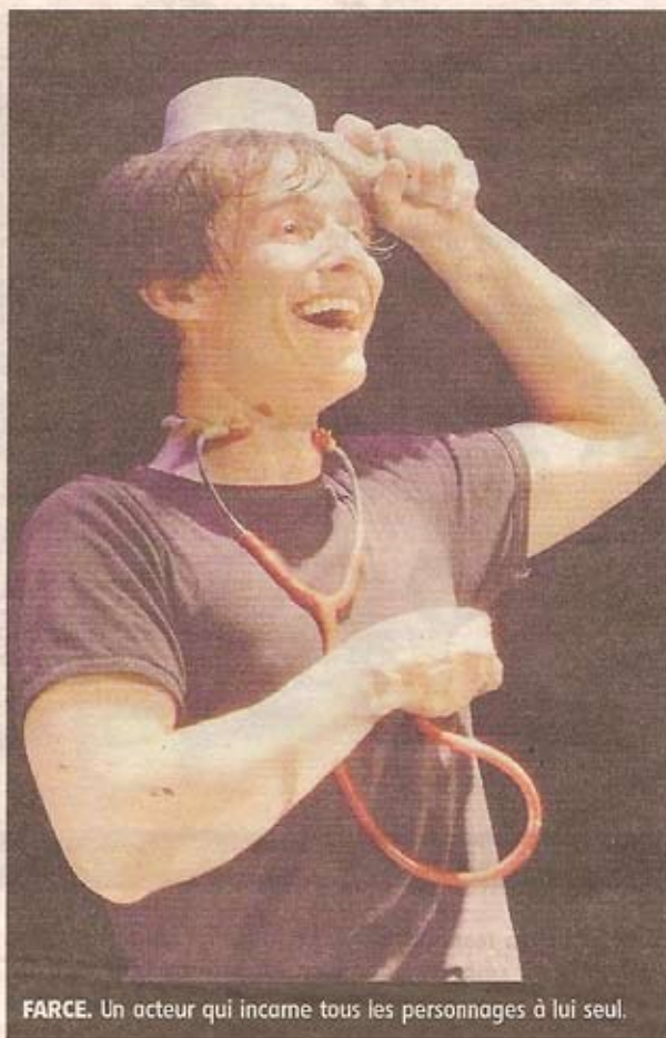
FARCE. Un acteur qui incarne tous les personnages à lui seul.

Visage en perpétuelle transformation, mains