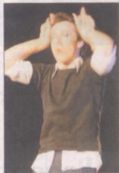
Un one-man-show délirant et décalé

Une version revisitée par la compagnie du Souffleur de