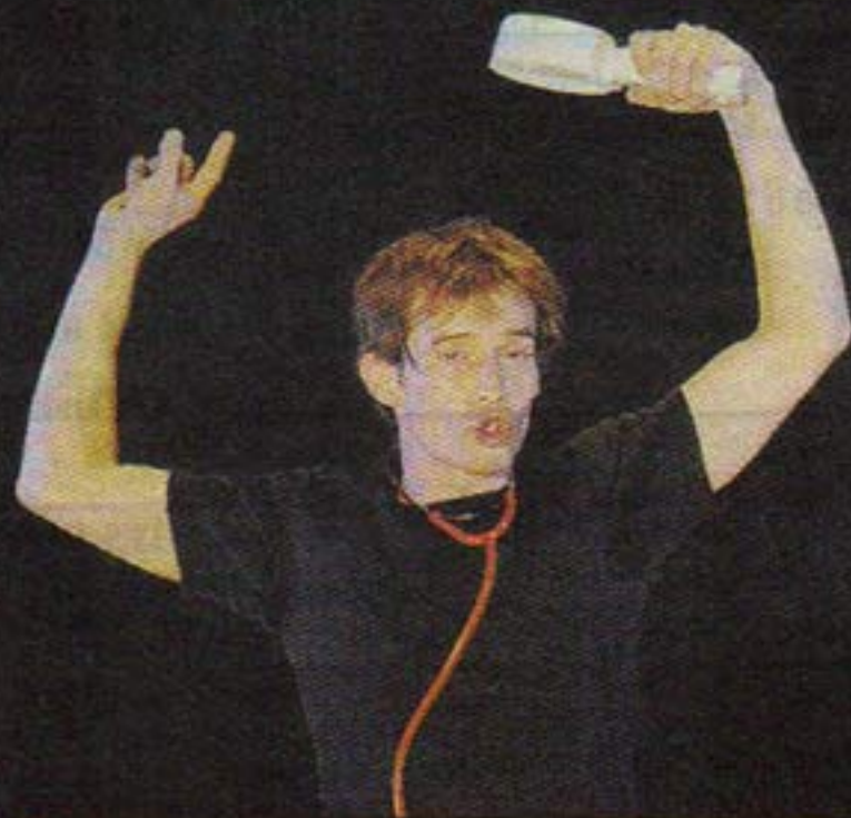
MÉDECIN MALGRÉ LUI. Seul en scène, le comédien joue tous les rôles.

➔ Billets. Réservations au 04.73.79.42.98, www.ot-gergovie.fr