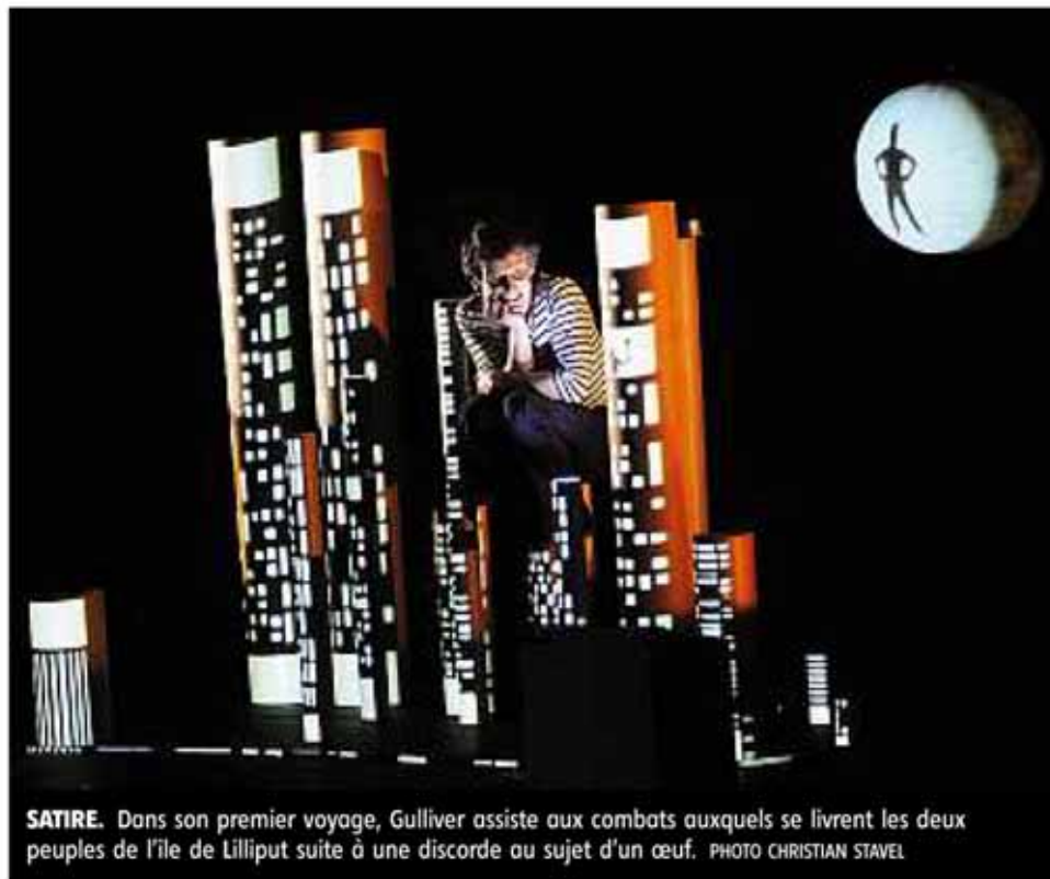
SATIRE. Dans son premier voyage, Gulliver assiste aux combats auxquels se livrent les deux peuples de l'île de Lilliput suite à une discorde au sujet d'un œuf.

De retour chez lui, l'ennui pousse Gulliver à reprendre le large pour arriver sur l'île de Brobdinginag peuplée de géants. Là, il devient la propriété d'un colosse qui en fait un objet de curiosité et d'exhibition. Dans