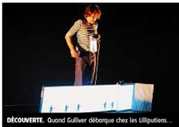
DÉCOUVERTE. Quand Gulliver débarque chez les Lilliputiens...

Le public issorien a suivi les tribulations de Gulliver, d'abord chez les Lilliputiens, puis chez les géants où il est retenu prisonnier. Son périple