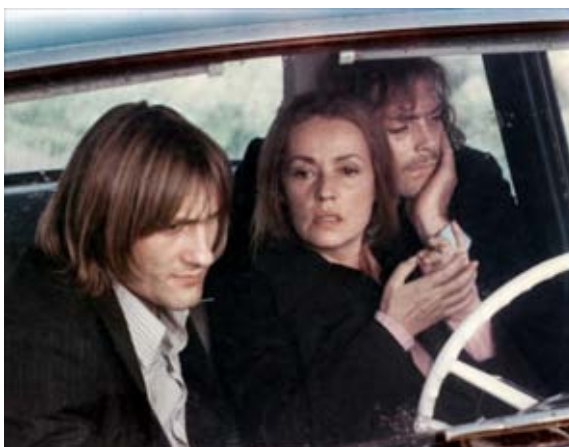
Avec Jeanne Moreau et Depardieu © Les Valseuses (1974), B. Blier

Et par la même occasion apparaîtront quelques grandes figures du cinéma Français avec qui il a tourné : Christine Pascal, Catherine Deneuve, Annie Girardot, Jeanne Moreau pour ne citer qu'elles, Coluche, Depardieu, Romain Bouteille, etc.