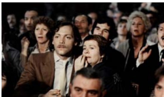
Avec Annie Girardot © La Clé sur la Porte (1978), Y. Boisset

Autant de propositions d'échanges et de dialogues avec des publics variés.