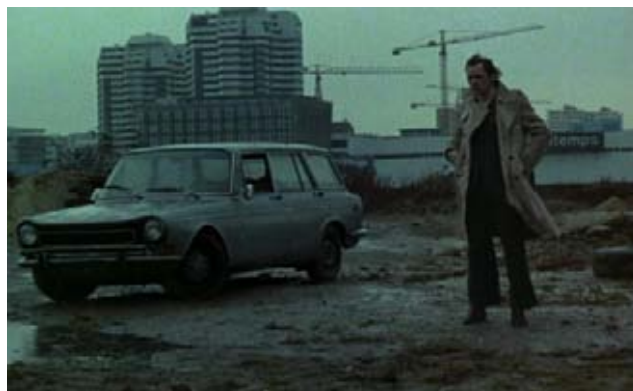
Patrick Dewaere

Né en 1947 dans une famille d'artistes, Patrick Dewaere devient acteur dès son plus jeune âge. Enfant de la balle, il enchaîne frénétiquement, pendant plus de trente ans, tournages et spectacles de théâtre. L'homme surdoué, brisé, mettra fin à cette spirale en se donnant la mort à l'âge de 38 ans. C'est son parcours artistique, ses choix audacieux, ses rencontres (Blier, Depardieu, Miou Miou, Coluche, etc.), ses coups de gueule envers la profession et les journalistes, son esprit de troupe (ses attachements au théâtre avec le Café de la Gare), ses amours romanesques fulgurantes et contrariées, la drogue, son besoin de défendre des personnages de loser, et sa mort sanglante... qui en font une figure tragique. Il incarne une « fureur de vivre » à la française. Aujourd'hui il est souvent cité par les comédiens de la génération suivante comme un modèle.