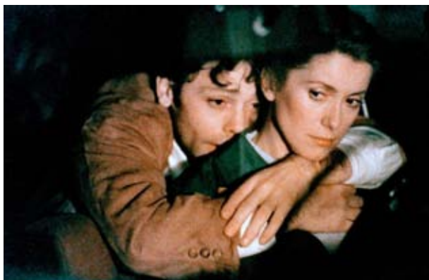
Avec Catherine Deneuve © Hôtel des Amériques (1981), A. Téchiné

Du vivant. J'imagine deux comédiens, deux comédiennes, un plateau très physique, très charnel. J'imagine un laboratoire de poésie, une fresque haletante, un dépotoir de sentiments, un plongeur au-dessus d'une fête. Je sais que ça finira dans le sang avec un bon coup de carabine ! J'imagine que je ne trouverai pas ça grave, je serai prévenu dès le début. Et dès le début, j'aurai envie de donner aux comédiens une matière complexe (images théâtrales, corps en mouvements, références à la filmographie de Dewaere, une dramaturgie en millefeuille), pour faire du plateau le lieu de l'auscultation de l'humain, d'une autopsie de l'acteur, de soi et de l'autre. Chaque acteur·rice pourra endosser le personnage de Dewaere. Chacun·e doit pouvoir s'emparer de ce monstre, cette machine à jouer.